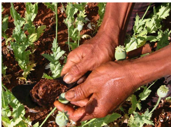
Récolte de l'opium, Birmanie