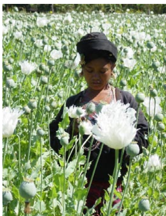
Harvesting opium, Burma