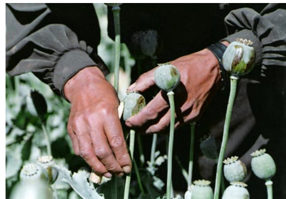
Poppy capsule lancing, Afghanistan

In Burma, as in Afghanistan, the opium economy has been partly responsible for financing the war efforts of some of the opposing factions. But if opium has been one of the sinews of war for Burmese and Afghan guer-