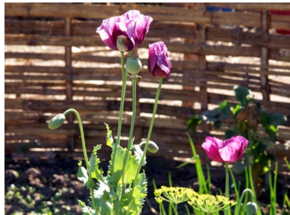
Poppies, Laos (P.-A. Chouvy)

The question is further complicated since it