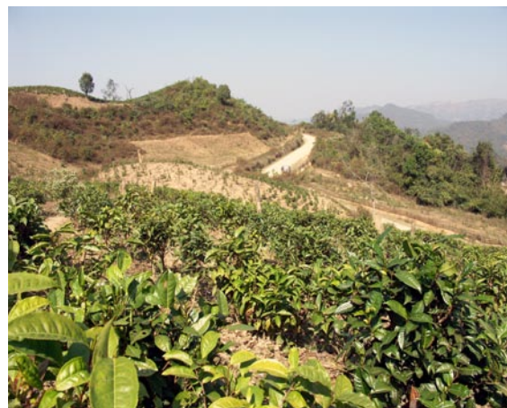
Substitution du thé au pavot, Laos, (P.-A. Chouvy)

Il est un aspect du recours à l'économie des drogues illicites qui n'a été que peu abordé alors qu'il affecte et peut même compromettre directement la stabilité des États concer-