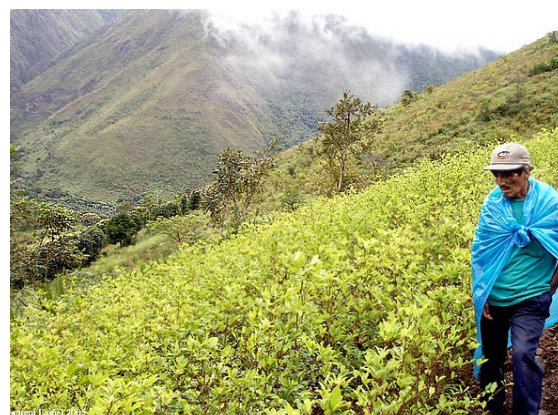
Coca field (L. Laniel)

In Peru, the 50,000 farmers of the Selva Alta still lag far behind their Bolivian counterparts in matters of organisation, while seeking support and inspiration from them. Potential for instability exists here because many of these farmers were part of the rondas campesinas , rural militia set up by the Peruvian military to fight the Shining Path rebels during the 1990s. The coccaleros therefore hold a lasting grudge against a state, which used to enlist their help against its Maoist enemy, but which now is eradicating their coca fields and imprisoning their union leaders. The roadblocks and demonstrations periodically organised to protest against eradication are occasions for them to remind the state that they have kept some of the weapons that the state distributed to their militias.