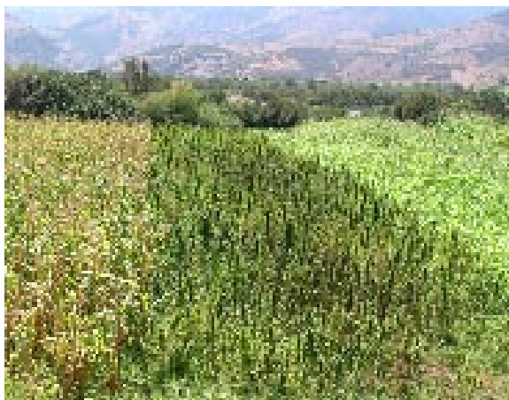
Cannabis et maïs, Maroc (K. Afsahi)

Bien que les superficies cultivées en cannabis soient vraisemblablement importantes en Afrique, que le continent soit le plus pauvre de la planète et que son histoire post-coloniale ait été marquée par une recrudescence de conflits armés de diverses natures, les connaissances relatives à l'économie du cannabis y sont, pour le moins, parcellaires. Dans son World Drug Report 2005, le bureau des Nations unies contre la drogue et le crime (UNODC) affirme : « Il existe très peu d'informations fiables sur l'extension de la culture du cannabis [dans le monde]. Bien que le cannabis soit la drogue illicite