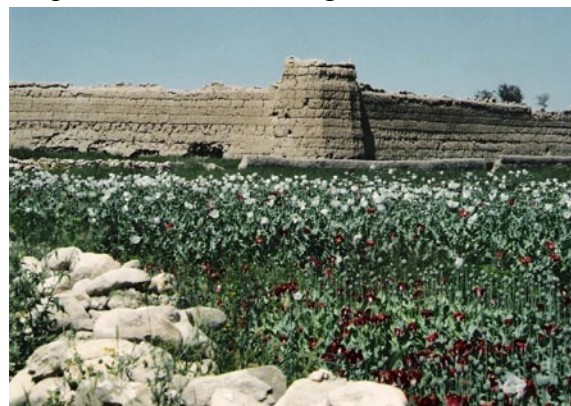
Champ de pavot, Afghanistan (D. Mansfield)

De fait, en Birmanie comme en Afghanistan, l'économie de l'opium a permis de financer en partie les efforts de guerre de certaines