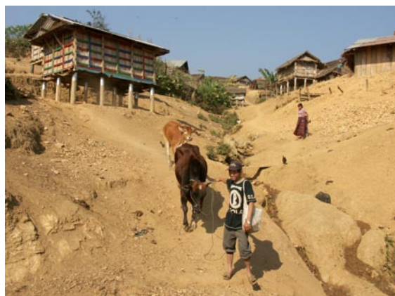
Cattle bank, Laos

Through the interplay of a range of national