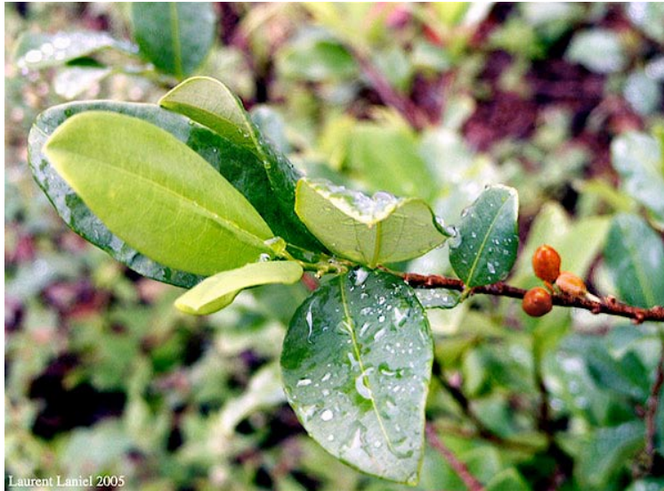
Coca leaves and fruit, Peru (L. Laniel)

rilla movement, which recently announced the launching of a counter-offensive. While the Colombian military has succeeded in imposing its authority on areas where guerrillas once made the law, they have not altogether managed to set up meaningful forms of governance in them. With the military in place, the remainder of the state apparatus has failed to make itself felt in these remote areas. This is one of the bitterest lessons to be learned from Plan Colombia: while it is not too difficult to capture a territory once held by insurgents, governing it is another matter altogether. The latter requires mobilisation of non-military resources along with strong political will, two conditions that have been largely lacking here. The present Plan Patriota offensive is taking the same road. As a result, as far as the inhabitants of these areas are concerned, the state—which has historically been absent—is now present but only as one more armed group, and with no stronger legitimacy than the others. This same state is also responsible for destruction of coca plantations (read: the main source of revenue for the local population) by aerial spraying of herbicides that also often destroy food crops. Meanwhile, alternative development programmes, supposed to compensate for the disappearance of coca fields and its