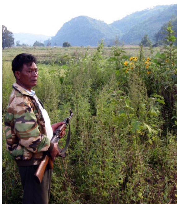
Membre de l'UWSA, Birmanie