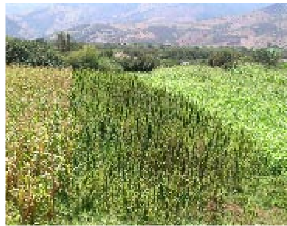
Cannabis and maize, Morocco (K. Afsahi)

Although cannabis appears to be very widely cultivated in Africa, the poorest continent in the world with a post-colonial history marked by a succession of armed conflicts, knowledge of the cannabis economy is at best fragmented. In its World Drug Report 2005, the United Nations Office on Drugs and Crime (UNODC) states, “There is very little reliable information on the extent of cannabis cultivation [throughout the world]. Although cannabis is the most consumed