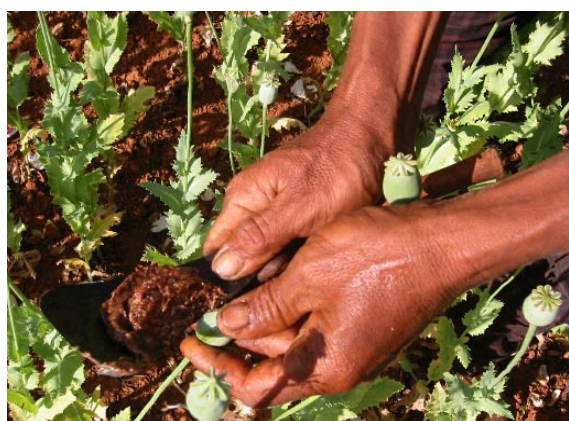
Harvesting opium, Burma