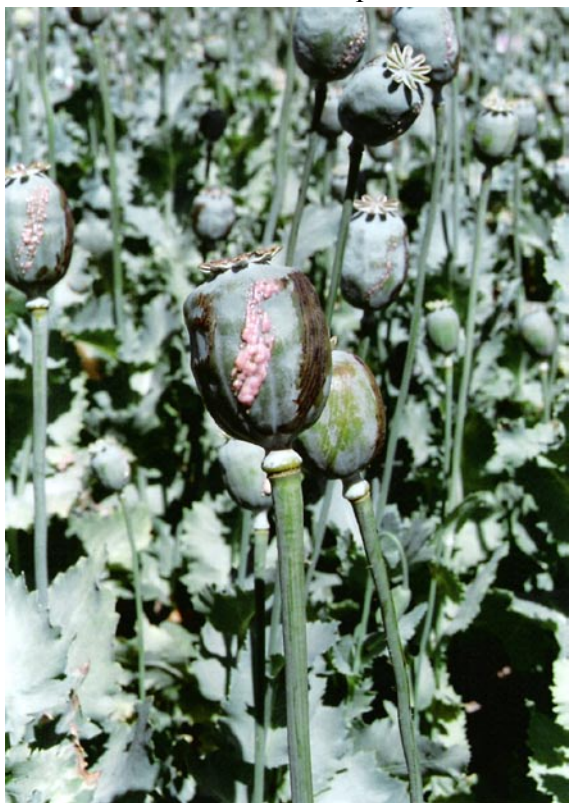
Opium coagulé sur des capsules de pavot, Afghanistan

La situation birmane diffère sur plusieurs points de celle de l'Afghanistan. D'une part, l'enjeu étatique n'y est pas celui de la reconstruction de l'Etat mais de la fragilité et de l'illégitimité de celui qui est en place. D'autre part, la junte au pouvoir a, pendant des années, tacitement autorisé certains groupes ethniques autonomistes à recourir à la production et au trafic d'opiacés, dans le cadre des cessez-le-feu qu'elle a conclus