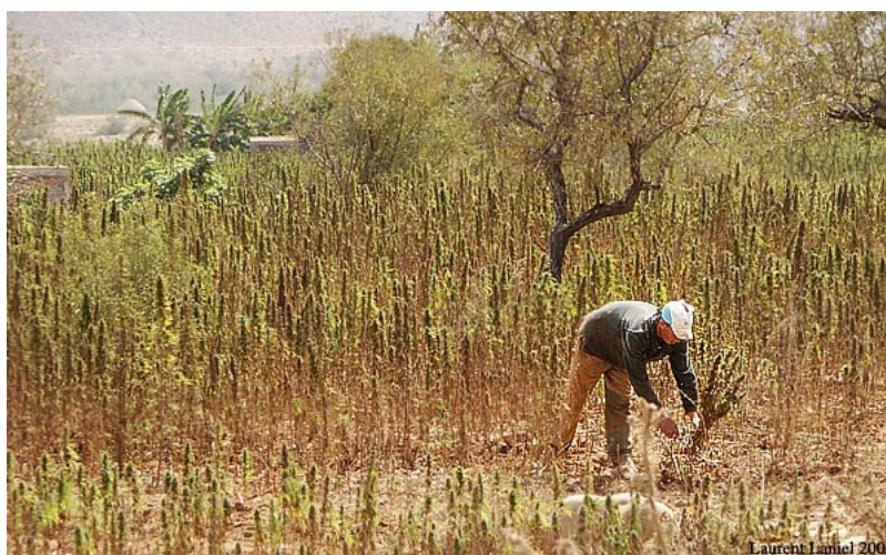
Harvesting cannabis, Morocco (L. Laniel)

fortiori its socio-economic and political stability depend on this production – a fact that poses a major problem for both the Moroccan state and the European Union, since