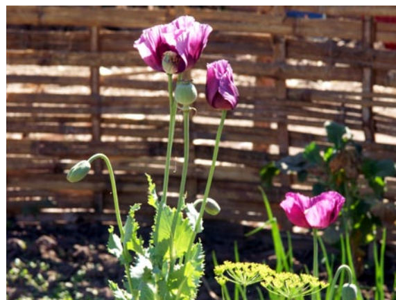
Pavots, Laos

En Afghanistan, où une paix fragile et une sécurité relative autorisent la lente recons-