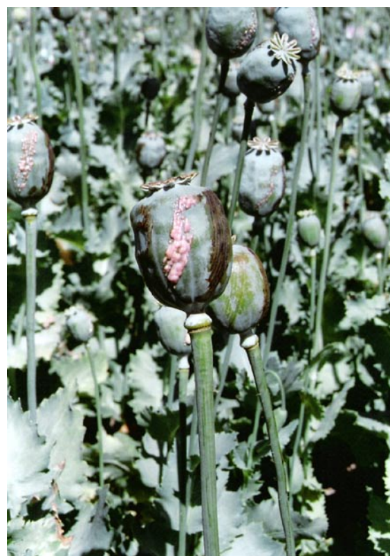
Coagulated opium on poppy capsules, Afghanistan

mitted that large-scale commercial opium production has been suppressed in a sustainable manner in the Kingdom. This success is largely due to the fact that, since the beginning of the implementation of poppy growing suppression programmes, the King of Thailand has made crop substitution and integrated development of the country's highlands a prerequisite to any forcible eradication. Initial introduction of crop substitution in opium producer areas took place in