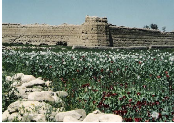
Poppy field, Afghanistan

illegal trade. But, through loss of political control on territory, the instability of certain states has simultaneously made possible and even encouraged development of such agricultural production and trafficking. Significant systemic effects have long exis-