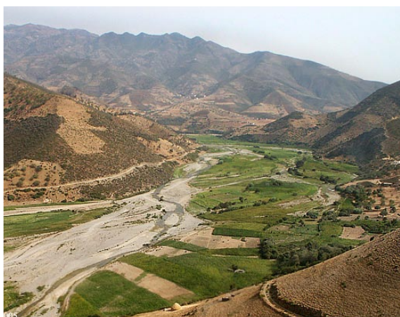
Vallée de cannabis et maïs, Maroc (L. Laniel)