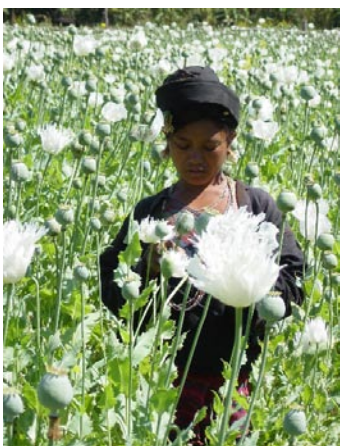
Récolte de l'opium, Birmanie