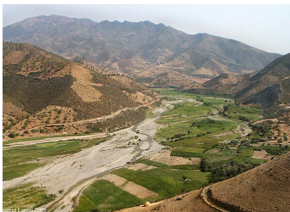
Interspersed cannabis and maize fields, Morocco (L. Laniel)

view of the role that cannabis has played in a number of African conflicts.