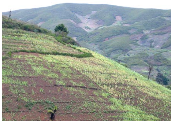
Essart de pavot, Laos (Naing Lin Aung)

En Afrique de l'Ouest, enfin, le recours au cannabis apparaît comme une réponse efficace à des blocages, essentiellement fonciers (épuisement des réserves forestières) et écologiques (salinisation des terres, avancées du désert, érosion due aux activités humaines, etc.), menaçant une stabilité sociale rendue possible par les cultures de rente. Le Ghana, l'un des principaux producteurs mondiaux de cacao, diffère d'autres pays de la région (Côte d'Ivoire, Liberia) puisque aucun conflit armé n'y sévit et qu'il est régi par un régime démocratique. On peut penser que l'économie de la drogue permettrait au Ghana, comme au Maroc, de maintenir des