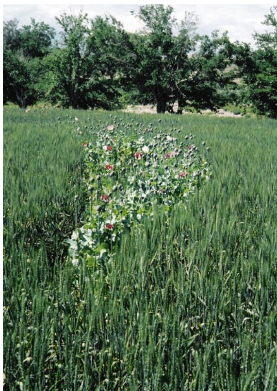
Poppies and wheat, Afghanistan (D. Mansfield)

However, there are new points in common.