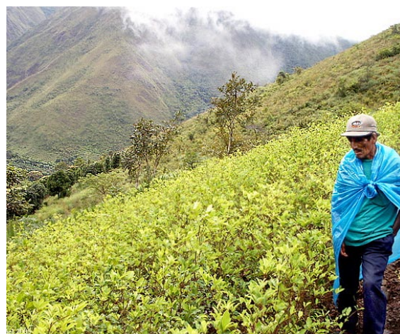
Champ de coca, Pérou (L. Laniel)

A l'heure du bilan, vingt-cinq ans et nombre d'infructueux programmes d'éradiquer et de développement alternatif plus tard, dans leur ensemble, les superficies plantées en coca des fronts pionniers n'ont, à peu de choses près, jamais été aussi importantes et les paysans qui en vivent aussi nombreux. Le conflit colombien n'a pas pris fin, mais redoublé d'intensité. Il s'est transformé en une guerre à trois camps, dont deux au moins – les mouvements de guérilla rurale et les paramilitaires qui les combattent – se financent en « taxant » la production de coca